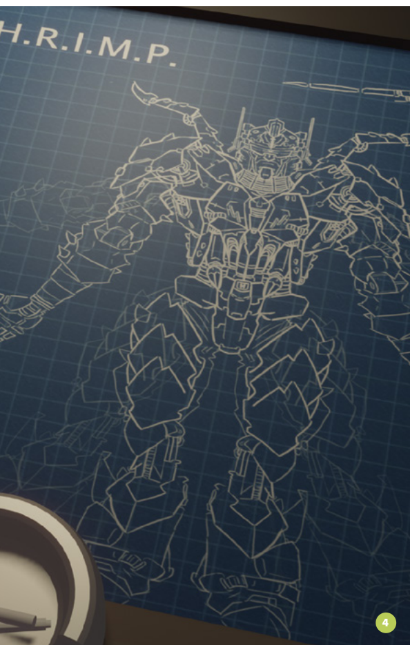
Das verwendete Bildmaterial zeigt Projektarbeiten unserer Auszubildenden und Absolvent*innen. ABB.1 Senna © Mau Don Le | ABB.2 Sketch © Philipp Raatz | ABB.3 Dreamer © Philipp Tretyakov ABB.4 P.I.S.T.O.L.S.H.R.I.M.P © Carlos Heinsch

Carlos, Absolvent 2020 im Fachgang 3D/Animation